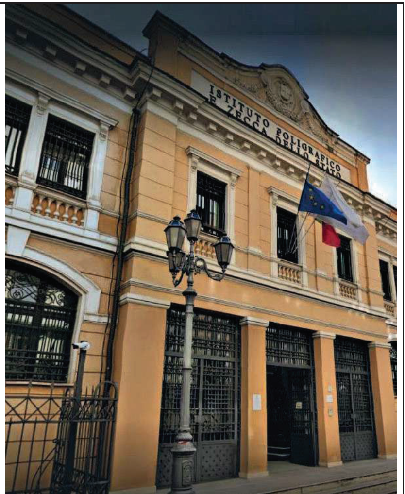
La sede dell'Istituto Poligrafico e Zecca dello Stato

I vertici dell'Ipzs avrebbero quindi dovuto bandire una gara d'appalto. Invece decisero di comprarle dalla stessa impresa che doveva provvedere all'upgrade di quelle di cui l'Istituto poligrafico aveva la disponibilità. «L'azione dell'Ipzs imputabile all'azione dei convenuti, che hanno operato ciascuno nell'esercizio dei poteri riconosciuti, si è collocata in modo grave al di fuori del perimetro del-