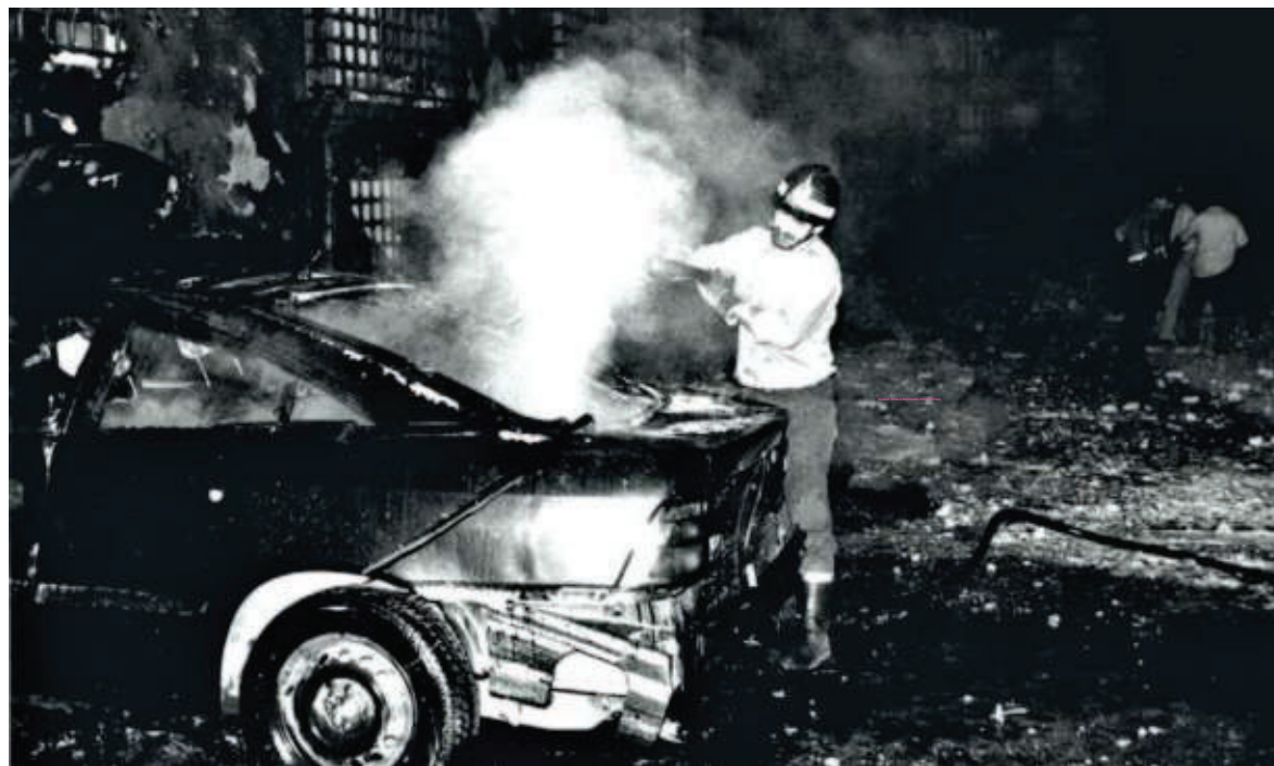
▲ Dopo l'esplosione L'intervento dei vigili del fuoco a San Giovanni