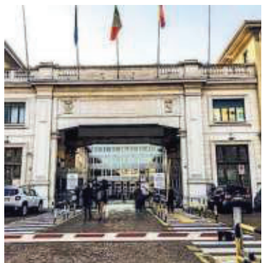
▲ L'operazione Alle Molinette