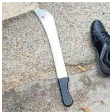
▲ Attacco Con un'arma modificata

Ha usato una mannaia per aggredire i vicini di casa. È successo a Premeno, nel Verbano, qualche giorno fa. Il protagonista di questa vicenda ha 70 anni, le sue vittime sono padre e figlio, suoi vicini di casa. L'uomo è stato denunciato dai carabinieri della locale stazione: le accuse sono lesioni personali aggravate e porto abusivo di oggetti atti a offendere. Il 14 febbraio scorso i militari hanno ricevuto una chiamata dalla vicina di casa dell'uomo, moglie e madre delle vittime dell'aggressione. «Il vicino ha ferito mio figlio con una mannaia», ha spiegato la donna. Le pattuglie sono arrivate poco dopo. Hanno trovato il più giovane del gruppo, un