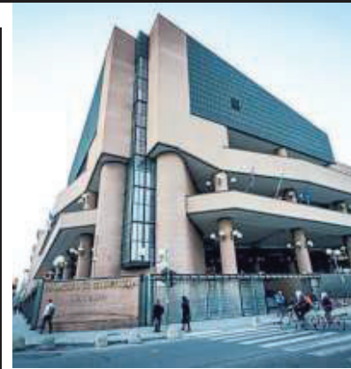
▲ Il processo Al tribunale di Torino