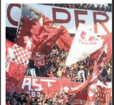
▲ In curva I tifosi del Toro