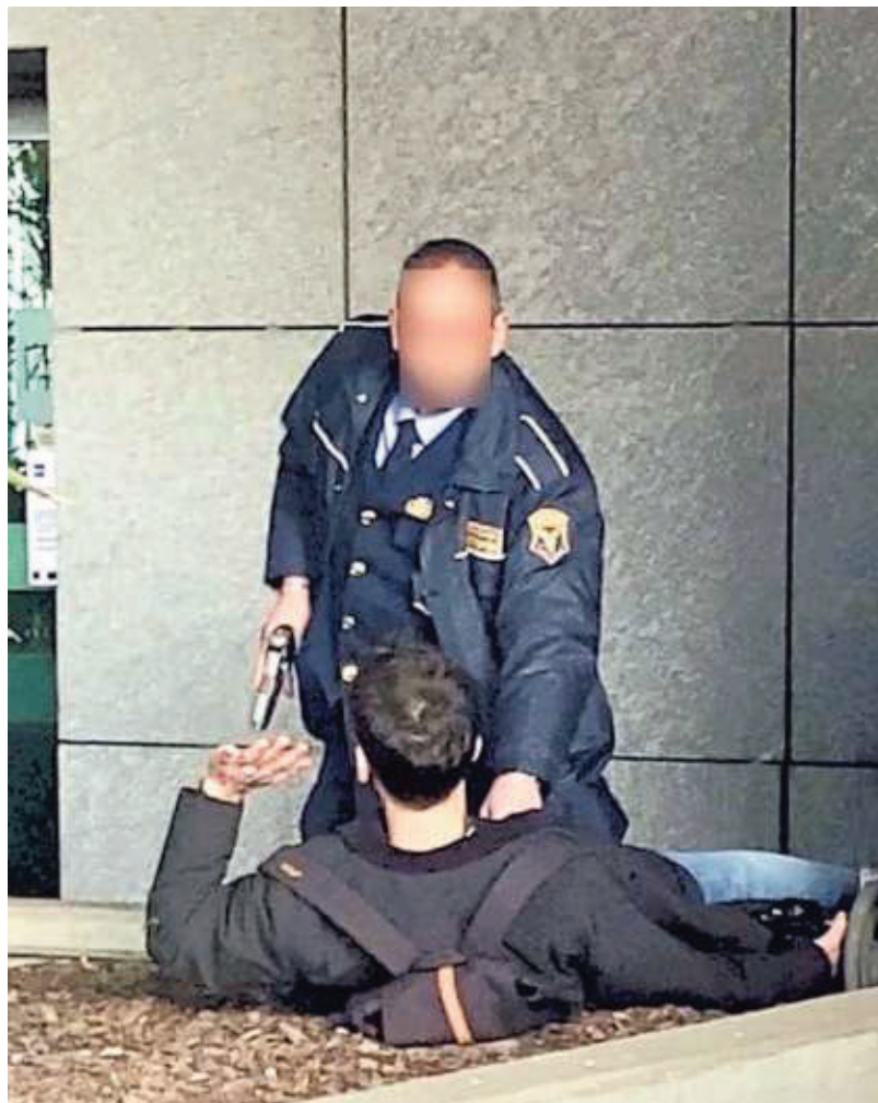
▲ Il blitz Protesta degli ambientalisti alla sede Rai, accertamenti sul vigilante

Pistola sul manifestante indagine sulla guardia