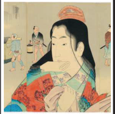
▲ In mostra Da giovedì a Torino