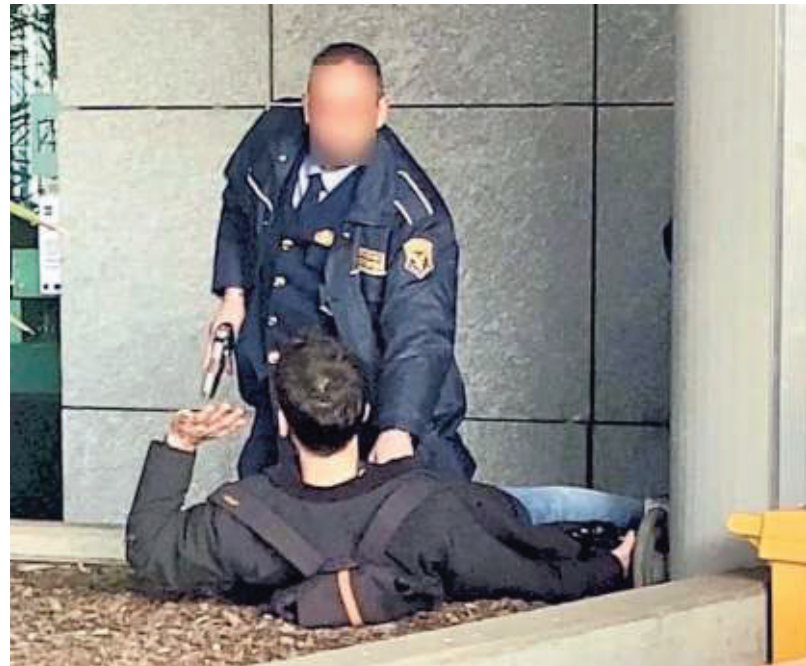
▲ In via Cavalli La guardia giurata blocca l'attivista per l'ambiente

È successo ieri mattina. La delegazione di ambientalisti, appartenenti al gruppo Extinction Rebellion, noto per le sue azioni di disobbedienza civile, era già stata in via Lugaresi 15, sede di Repubblica e Stampa , e anche alla Rai di via Verdi. Via Cavalli 6 era l'ultima tappa. Lo slogan era sempre lo stesso: «Crisi climatica: governi colpevoli, dirai la verità?». Arrivati in via Cavalli cinque persone hanno cercato di superare l'in-