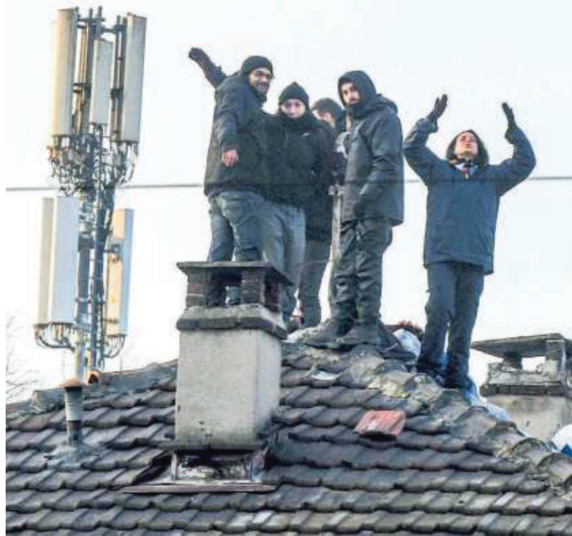
▲ Lo sgombero La Digos ha sgomberato il centro sociale nel 2019

Gli arresti erano scattati il 7 febbraio 2019, quando l'operazione "Scintilla" aveva portato allo sgombero della casa occupata di via Alessandria. Erano seguite giornate di