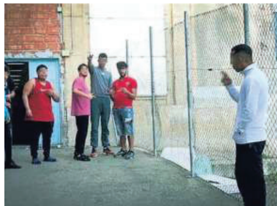
▲ La fuga Il ragazzo era stato arrestato per rapina

agenti della polizia penitenziaria si erano accorti che sotto le lenzuola non c'era il detenuto ma un cuscino e delle coperte arrotolate. Il giovane si era infilato in un buco realizzato nel cassone della tapparella e di lì, togliendo una grata, si era trovato nel giardino e a pochi passi dalla libertà. Nelle telecamere si era visto il ragazzino attraversare il prato con lo zainetto a spalle, senza neanche girarsi indietro. Dietro la recin-