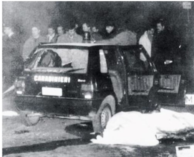
Quattro gennaio 1991: la strage del Pilastro compiuta dalla banda della Uno Bianca