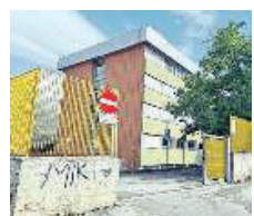
L'Isti di Pratola Peligna

In quest'arco di tempo, questa la strategia, sarà conclusa l'indagine di terzo livello che dovrebbe confermare però quella di secondo: la scuola per tornare "pienamente" operativa avrà cioè bisogno di interventi di rinforzo sulle scale (di poco conto) e, molto più invasivi e dispendiosi, per la palestra e i laboratori. Tuttavia, al netto delle verifiche, si opterà verosimilmente per un'altra soluzione: le scale saranno interdetto e due piani della scuola potranno così essere riaperti. Dentro ci andranno tutti gli studenti dell'Isti e due dei tre laboratori che saranno trasferiti. Per il terzo, quello di