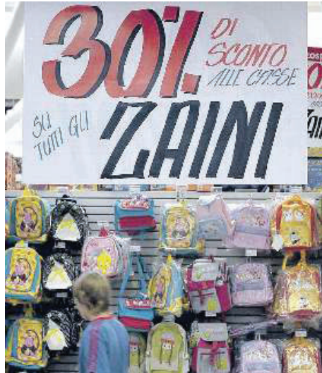
Tanti gli sconti e le offerte nei supermercati

Manlio Biancone © RIPRODUZIONE RISERVATA