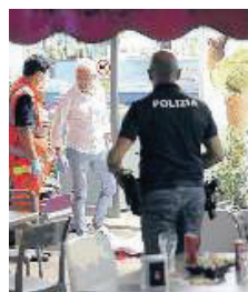
Il luogo della sparatoria

rio, mentre per il centrosinistra la giunta di centrodestra ha usato i propri poteri solo in chiave anti-movida. La cartina di tornasole, per il sindaco, che mostrerebbe come Pescara sia percepita come sicura, è che nell'assise civica «i cittadini non sono presenti. Non sono venuti perché il discorso sulla sicurezza non è avvertito da loro. Pescara la considerano generalmente una città sicura, al di là degli episodi di teppismo che ci sono stati, al di là del difficile rapporto in alcune zone con gli extracomunitari. De Luca a pag. 36