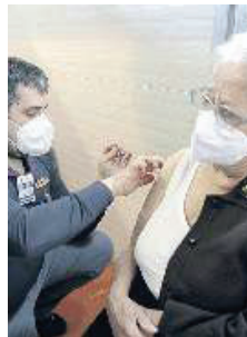
A disposizione i nuovi vaccini