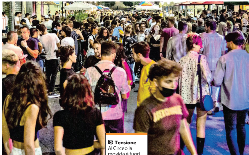
📷 Tensione Al Circeo la movida è fuori controllo: il Comune fa ricorso alla vigilanza privata

● 2020 Per i troppi eccessi della movida vennero per la prima volta ingaggiati dal Comune i vigilantes.