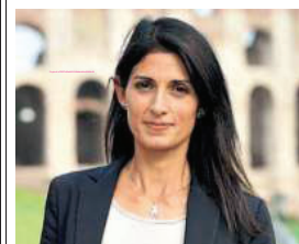
▲ L'ex sindaco Virginia Raggi

“E ora le liste come le facciamo? A umma a umma?”