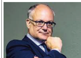
▲ Il sindaco Roberto Gualtieri

L'alleanza rosso verde che sta facendo tribolare il Pd di Enrico Letta, oggi in Campidoglio darà filo da torcere al sindaco Roberto Gualtieri. Perché, ancora una volta, la questione ambientale divide i vari attori nel campo del centrosinistra e il termovalorizzatore continua a rappresentare l'impianto della discordia.