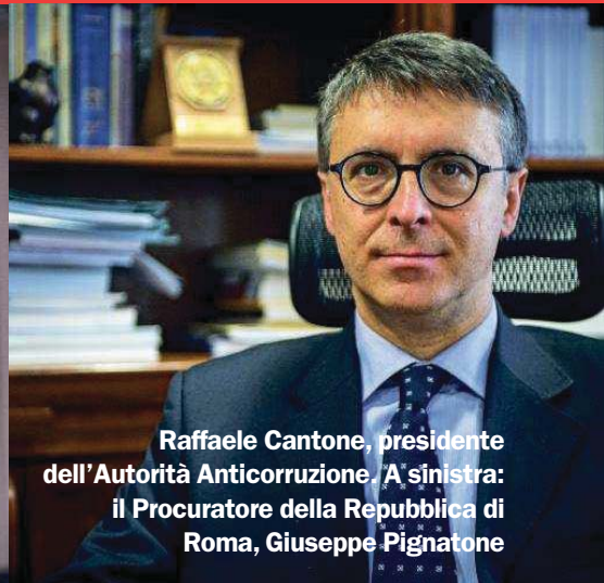
Raffaele Cantone, presidente dell'Autorità Anticorruzione. A sinistra: il Procuratore della Repubblica di Roma, Giuseppe Pignatone