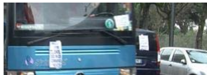
Turismo e commercio, da fiore all'occhiello a specchio di una città