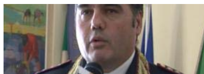
Torre del Greco, arriva il nuovo comandante dei vigili: "Massimo impegno per la città, collaborazione con i cittadini" - VIDEO