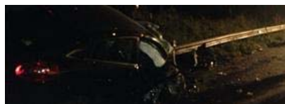
Cilentana 'strada della morte': le immagini della tragedia