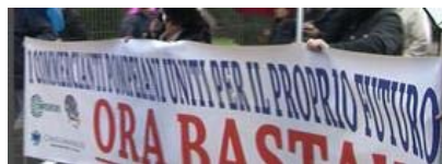
Pompei città morta, protestano cittadini e rappresentanti di categoria / VIDEO