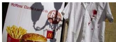
Lavoro: camici macchiati 'sangue' davanti McDonald's Napoli