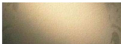
Musei: buco nel muro capolavoro, muratore lo stucca