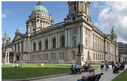
Ecco perché Belfast è una città assolutamente da visitare (ireland.com)