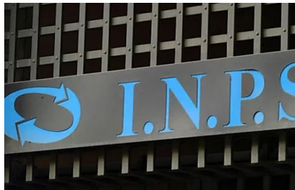
INPS approva i prestiti per pensionati a tasso agevolato in convenzione - Verifica se rientri (il.facilefinanza.com)