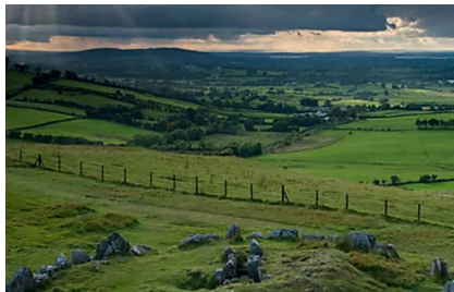
L'Ireland's Ancient East è ricco di racconti magici: ecco 5 storie spettacolari