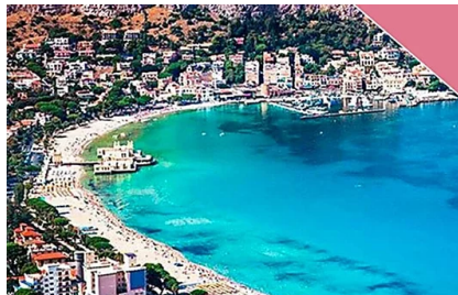
Sei pronto? Clicca e vola in Italia da 39€ solo andata tutto incluso (Alitalia)