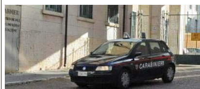
L'arresto è stato eseguito dai carabinieri

VIOLENZA IN CASA. Giovedì notte l'arresto