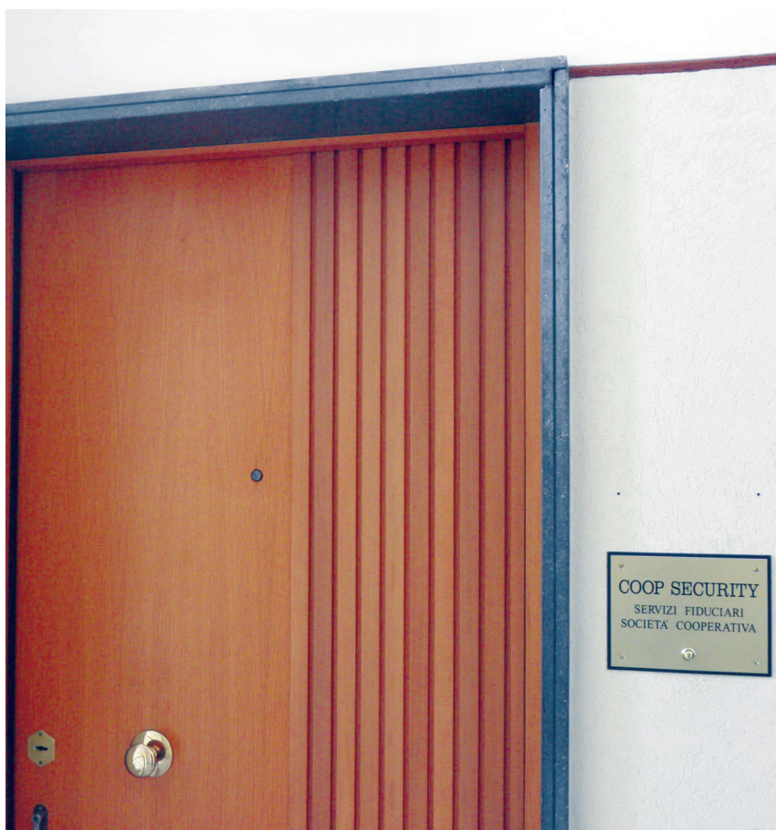
Nella foto la sede della Coop Security chiusa dalla polizia

TARANTO - Avrebbe truffato oltre cento disoccupati promettendo posti da vigilante. Non contento avrebbe raggirato anche la fidanzata e alcuni parenti della ragazza, spacciandosi per funzionario della società autostrade con uno stipendio da 20 mila euro al mese. Un vero mago della truffa che non guardava in faccia a nessuno e che già nel 2006 era stato denunciato a Vicenza per essersi spacciato per ispettore di polizia e per aver pagato con assegni scoperti l'acquisto di oggetti per un valore di 8mila euro. Un 38enne è finito nuovamente nella rete della polizia. Da febbraio gli agenti della squadra di Polizia Amministrativa, diretti dal dottor Domenico Sammaruco, stavano svolgendo indagini su uno pseudo istituto di vigilanza denominato "Coop Security - Servizi Fiduciari", con sede in viale M. Grecia, gestito dal 38enne. Gli investigatori hanno accertato che l'istituto non era autorizzato. Attraverso la pubblicità e con il passaparola il presidente avrebbe promesso posti di lavoro per guardia giurata che in realtà non esistevano. Le vittime