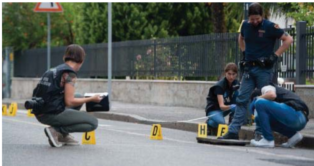
Il lavoro della Polizia scientifica sul luogo in cui è avvenuta la sparatoria

Numerosi colpi esplosi, lungo lavoro della Scientifica per decifrare la «geografia» dei bossoli sul terreno Un testimone: «Il feritore fuggiva verso un cortile»