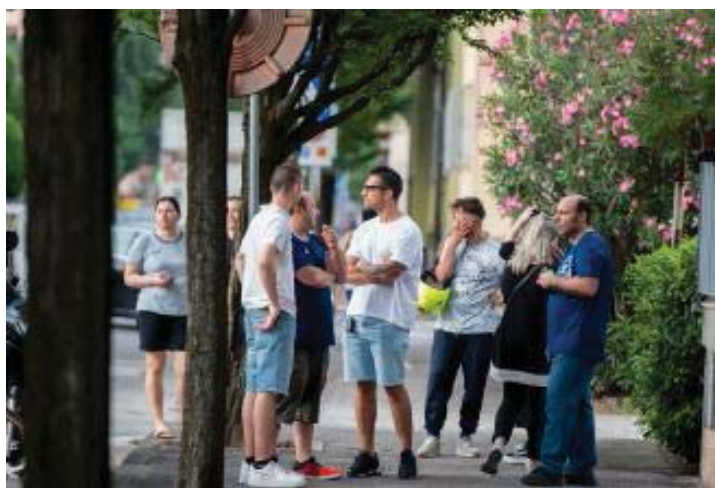
C'è chi si è ritrovato sul marciapiede per capire cos'era successo