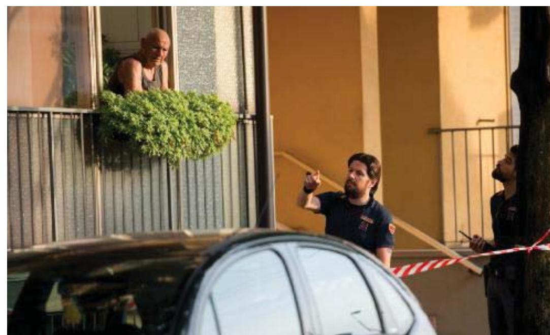
I poliziotti chiedono informazioni agli abitanti della via dopo la sparatoria

Pochissimi passanti in strada, persone che chiedono di varcare l'area delimitata dal nastro bianco e rosso per tornare a casa. Anche la «scena del crimine» alla fine perde interesse per i pochi residenti che (è l'ora di cena) abbandonano i poggiali. In Questura c'è un uomo che dovrà spiegare. Un altro è in un letto d'ospedale. Agli investigatori il compito di incollare i frammenti sparsi di una sparatoria, per ora, senza movente visibile. ●