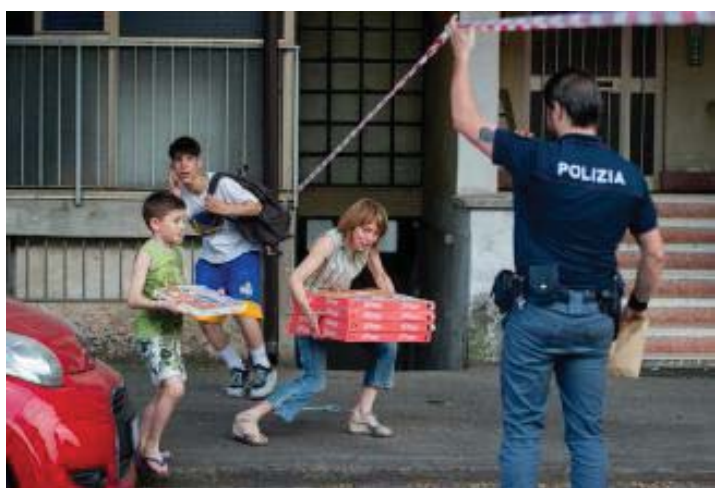
Alcuni residenti oltrepassano la delimitazione posta dalla Polizia