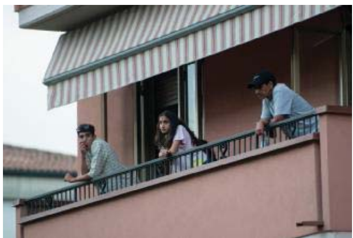
Gli abitanti della via hanno seguito la scena dal balcone