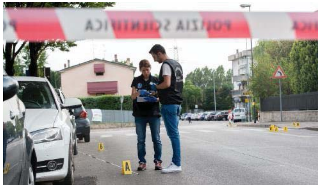
Divieto di transito in Via Villafranca, zona residenziale nel quartiere Santa Lucia e luogo della sparatoria