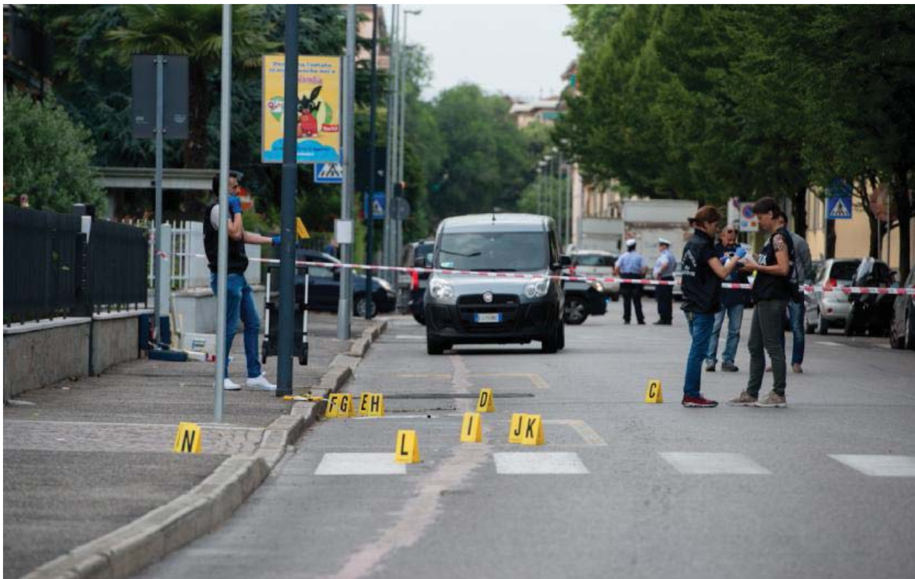
La strada dove è avvenuta la sparatoria delimitata con il nastro biancorosso, la Scientifica al lavoro per i rilievi sui colpi sparati

In molti ieri sono rimasti affacciati alle finestre per scrutare l'area delimitata dalla Scientifica fino alle 20.30. Ma quasi tutti erano tornati a casa dopo la sparatoria. Anche la giovane Melissa è transitata in quel tratto, per la curiosità di vedere con i suoi occhi quanto riportate dal fidanzato. «I malviventi ci sono ovunque ma confesso che cambierei quartiere», dice. «Il portoncino blindato del nostro condominio è stato forzato più di una volta - conclude - e mi sono già trovata l'auto bottata sotto casa».