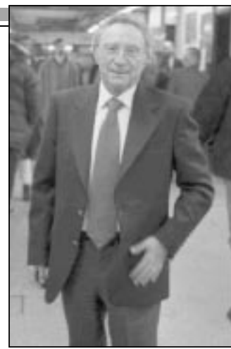
Il presidente del Tribunale di Roma Luigi Scotti

nando l'affollamento dei ruoli di udienza. Non è difficile capire che la prima conseguenza è il naturale accorciamento dei tempi dei processi. Ed ecco il civile, che è sempre stato il vero problema della giustizia capitolina. Lo