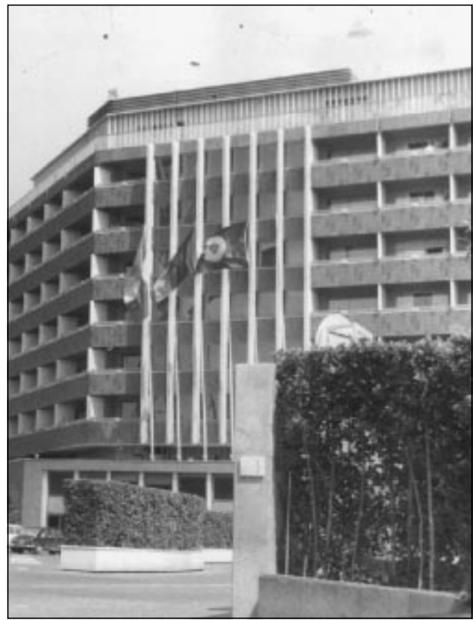
L'hotel Hilton di Roma a Monte Mario