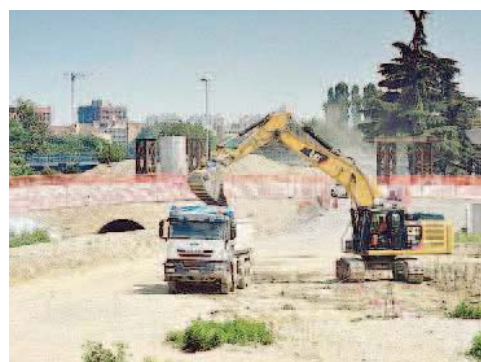
I CAMION I vigili controlleranno i mezzi che lavorano per Expo anche fuori dai comuni di Rho, Pero Milano e Baranzate

zione investigativa antimafia, la Dia, «nell'azione di controllo preventivo sugli operatori economici interessati alla realizzazione delle opere per Expo», a rendere più facile il coordinamento delle polizie locali dell'area metropolitana e delle sedi territoriali di polizia e carabinieri. La società guidata da Giuseppe Sala, infine, si impegna a fornire scadenze regolari i cronoprogrammi delle opere, così da poter pianificare i controlli, e promuovere l'adesione (anche se volontaria) dei Paesi partecipanti ad Expo (oggi sono 141) ai protocolli di legalità.