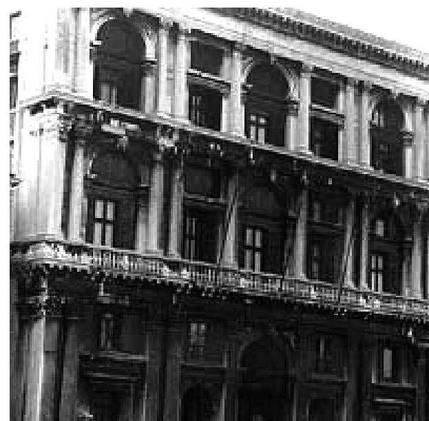
La corte d'appello di Venezia