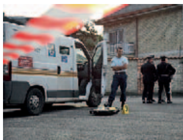
Il sopralluogo in via Carafa

mento di 50mila euro di provvisoria. I fatti risalgono al 15 febbraio di quest'anno, quando l'imputato incontra la donna in piazza Merry Del Val, a Trastevere. E' qui, forse sotto l'effetto dell'alcol, che il quarantenne romano, convinto di aver riconosciuto una tale «Roberta», si avvicina alla passante iniziando a ricoprirla di insulti. La signora, incredula, aveva tolto la sciarpa che le copriva il viso nel tentativo di risolvere l'equivoco, riuscendo però solamente a