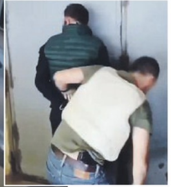
IL BLITZ A SAN GIROLAMO Alcuni fasi dell'intervento della Squadra Mobile di Bari contro banda armata di rapinatori che si preparava a un assalto