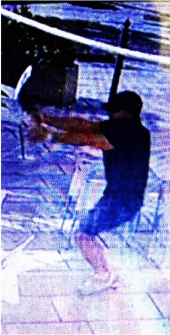
Omicidio Marongiu: l'immagine inedita del killer