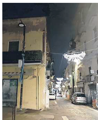
CORSO SIRENA Il luogo del raid

e tanta paura, fino all'arrivo degli agenti del commissariato locale, allertati da una segnalazione.