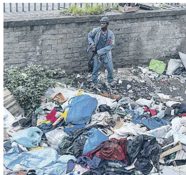
LA DISPERAZIONE I carabinieri nella baraccopoli dov'è avvenuta la violenza. In alto, uno scorcio del campo trasformato in una discarica a cielo aperto