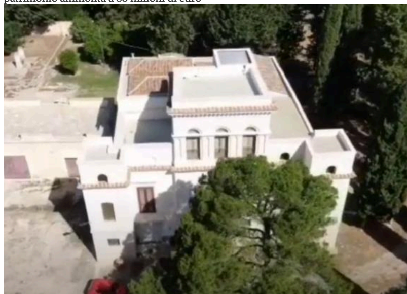
Il castello confiscato