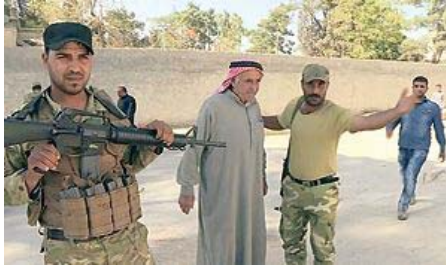
TRUPPE Le prime immagini delle forze filo-turche a Dabiq, diffuse dalla Qasioun News Agency