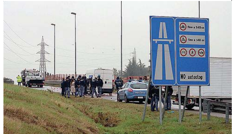
IL GIALLO I rilievi della polizia sul furgone assalito Per coprirsi la fuga i banditi hanno anche gettato chiodi sull'asfalto

Bollate: fuga contromano, armi da guerra e inquietanti analogie