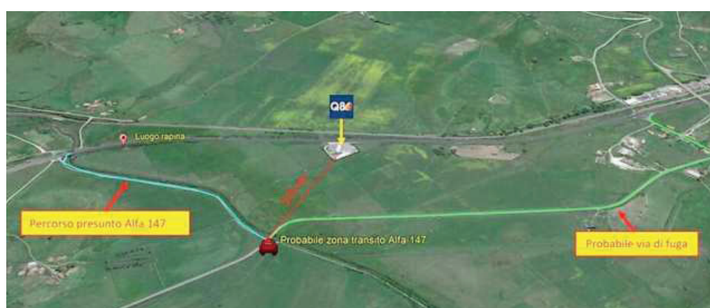
La cartina del percorso seguito dai banditi dopo avere assaltato il furgone portavalori nei pressi di Giave

La stradina di colore celeste, sulla sinistra, potrebbe essere stata usata per raggiungere il punto della rapina, poco prima dell'area di servizio della Q8. L'Alfa 147 avrebbe poi percorso a ritroso la stessa strada bypassando il tratto bloccato dai mezzi in fiamme e guadagnando la fuga verso la zona industriale di Giave. In questo modo i banditi avrebbero avuto la possibilità di accedere nuovamen-