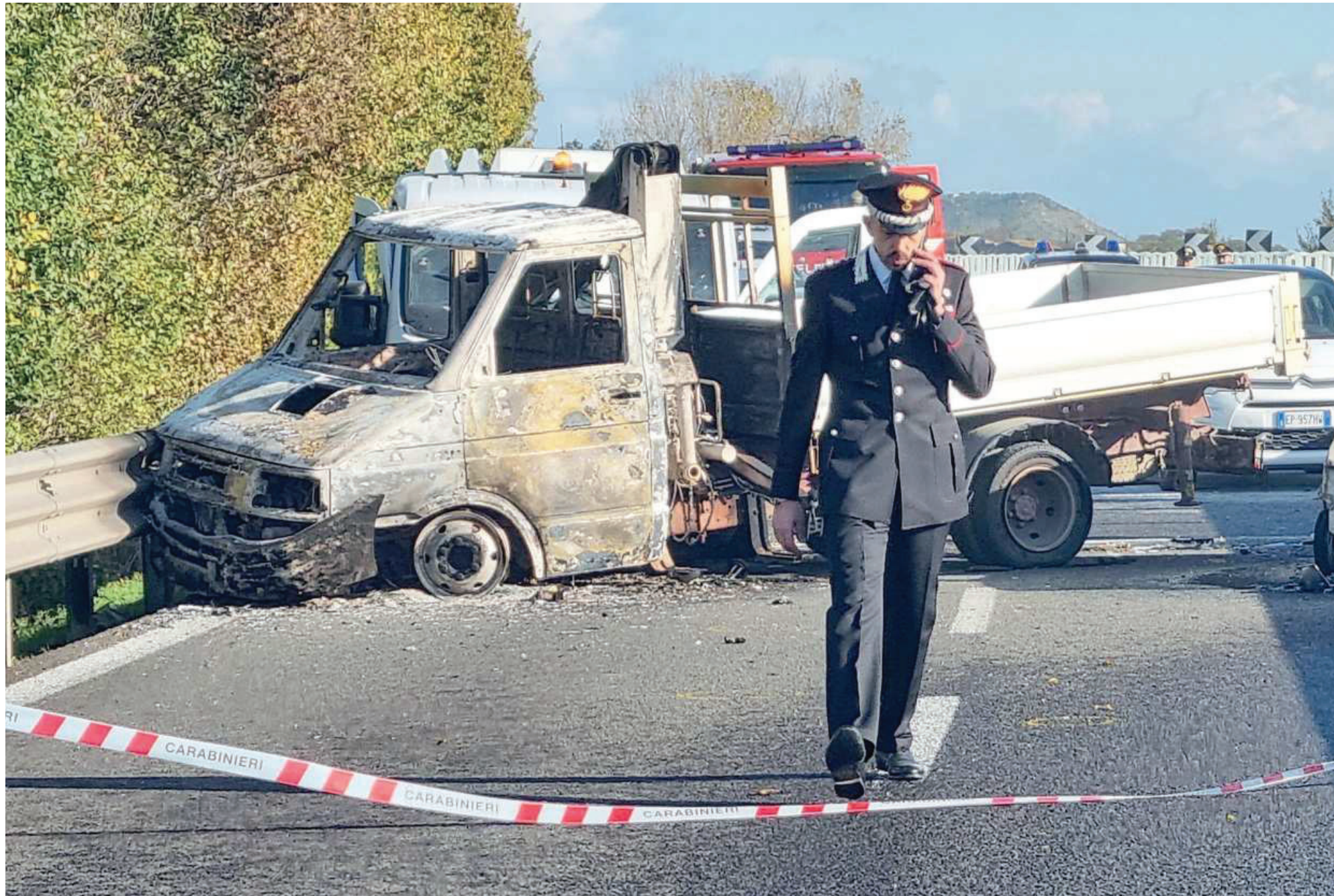
I carabinieri sul luogo dell'assalto al furgone nella mattinata di mercoledì