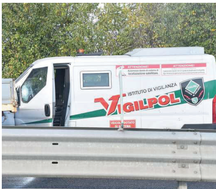
Il furgone portavalori della Vigipol obiettivo della banda dei rapinatori