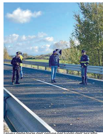
I rilievi delle forze dell'ordine nel luogo dell'assalto