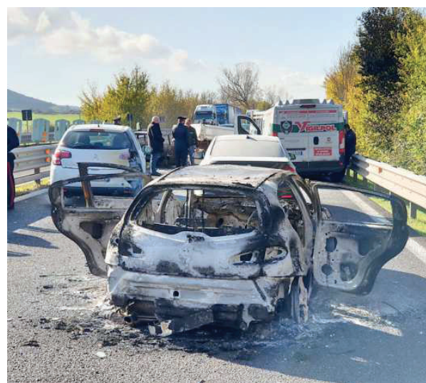
In alto, i fori sul parabrezza dell'auto e le vetture incendiate a Badde Salighes