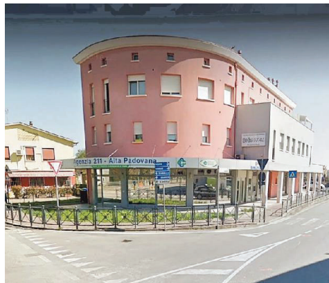
La Banca di Credito Cooperativo di Roma a Reschigliano

Il filmato è ora al vaglio dei carabinieri della stazione di Campodarsego che stanno tentando di risalire agli autori anche attraverso il veicolo usato. Non si conosce l'entità del bottino arraffato dai due delinquenti, ma dovrebbe essere piuttosto