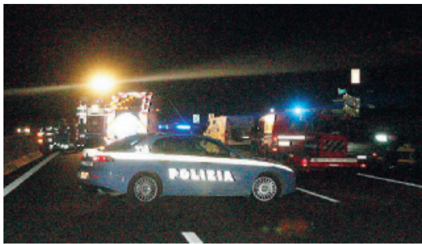
TERRORE Scena da Far west sull'autostrada per rapinare il furgone

LA MOBILE e la Polstrada setacceranno per tutta la notte la zona. La Scientifica cercherà tracce utili alle indagini: agli inquirenti è subito balzata agli occhi la 'spettacolare' e drammatica dinamica dell'assalto. Tale e quale a quella utilizzata per l'agguato compiuto tra Bergamo e Brescia il 9 giugno scorso.