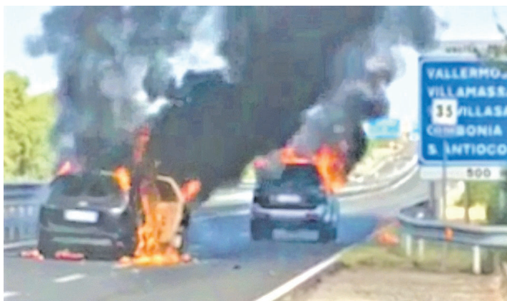
Le auto incendiate dai malviventi per coprirsi la fuga

comando di rapinatori è entrato in azione. Sicuramente erano almeno cinque, a bordo di un Suv, di un Mitsubishi Pajero e di un altro fuoristrada che seguiva il gruppo. In un tratto di rettilineo dopo lo svincolo per Vallermosta, i primi due veicoli hanno inchiodato occupando