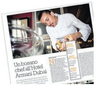
Un bosniaco chef all'Hotel Ammani Dubai