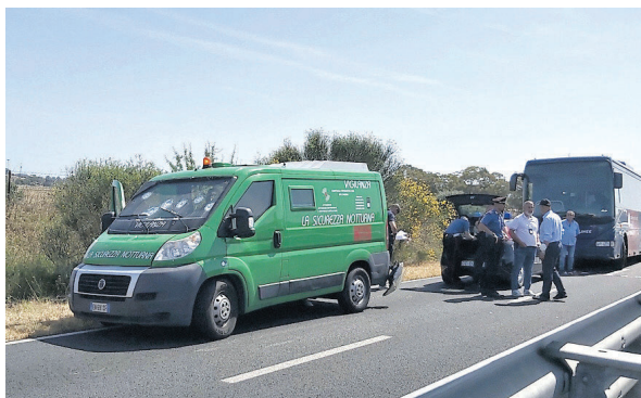
Carabinieri e polizia sulla strada statale 130 subito dopo l'agguato

Tutto è cominciato alle 8,15 di ieri mattina quando al chilometro 34+300 della strada statale 130, fra Siliqua e Domusnovas in direzione Iglesias, il