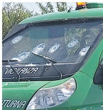
Il furgone blindato con i segni della sparatoria