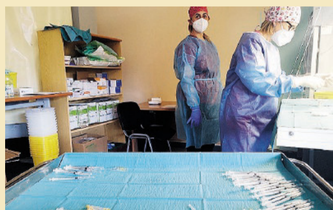
LOTTA AL COVID Vaccini pronti per essere somministrati

Vaccini a Foggia per 12mila docenti Assebramenti al Palasport di Trani