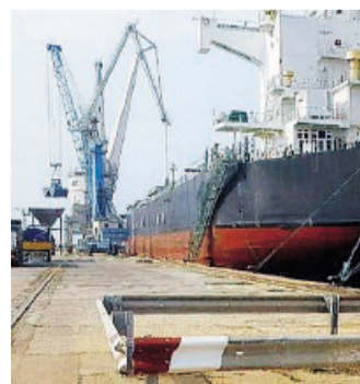
MANFREDONIA Il porto

● Dopo anni di stasi il movimento merci nel porto industriale di Manfredonia fa registrare un significativo aumento con un più 8,7% rispetto allo scorso anno. Le prospettive per lo scalo, all'attenzione di multinazionali che intendono investire importanti risorse, sono dunque più rosee rispetto ad alcuni anni fa dopo il passaggio all'Autorità portuale del basso Adriatico.