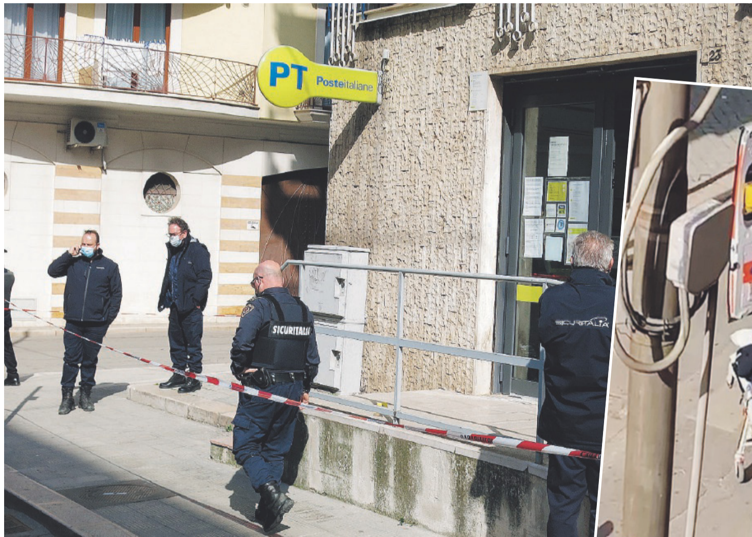
CANOSA L'assalto al portavalori e all'ufficio postale. Sotto, uno dei vigilanti feriti viene soccorso e trasportato in ospedale

Nella Bat e nel Foggiano troppe scorribande di gruppi paramilitari di rapinatori