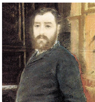
«Autoritratto» di Giuseppe De Nittis