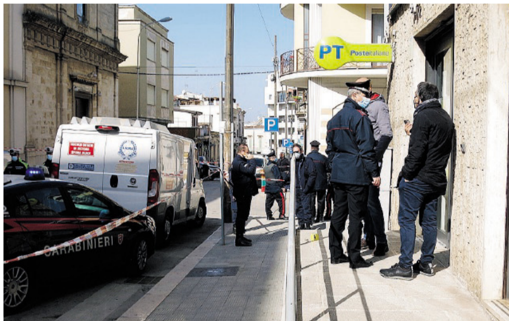
CANOSA Il portavalori e l'ingresso dell'ufficio postale dove è avvenuto l'assalto

BENE IL «PEBA» A FOGGIA MA ADESSO VA ATTUATO