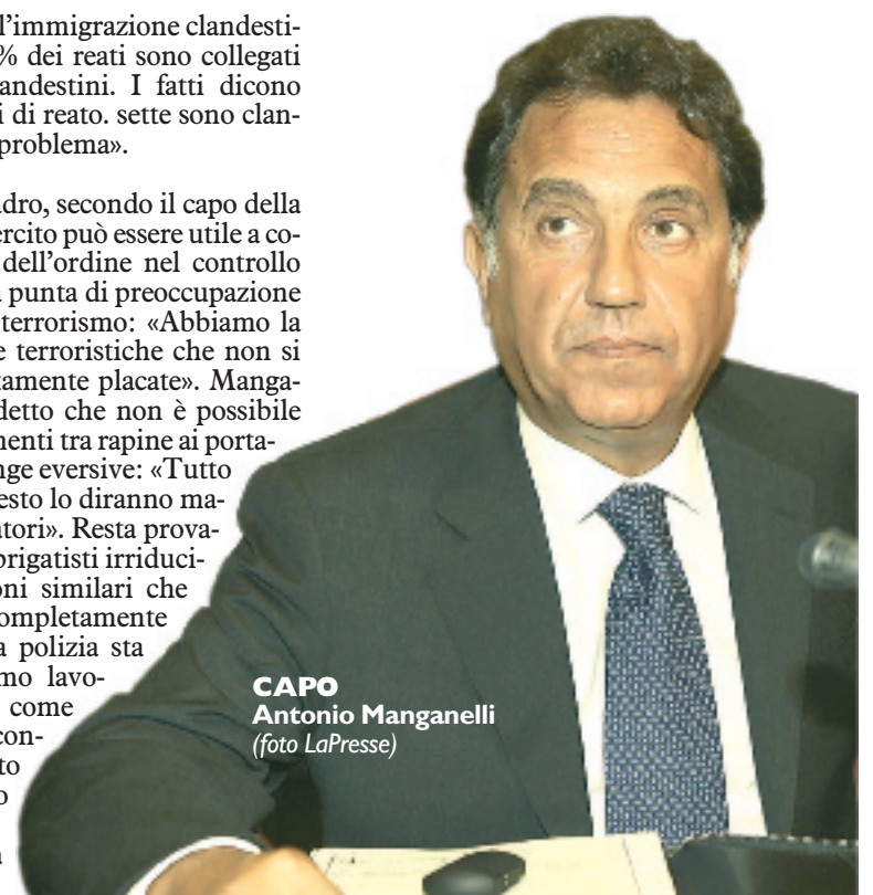
CAPO Antonio Manganelli