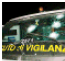
I colpi sul furgone

Parla la guardia privata rapinata "Ci è andata bene non volevano spararci addosso"