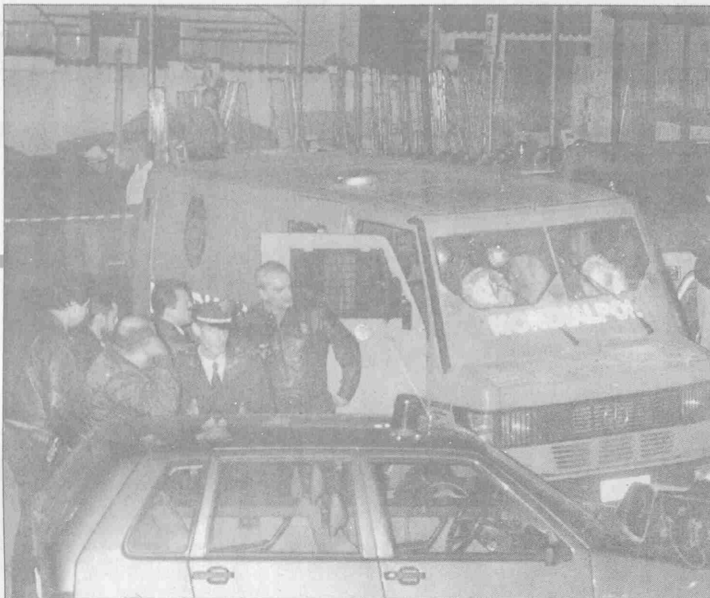
Il luogo della tentata rapina subito dopo l'agguato