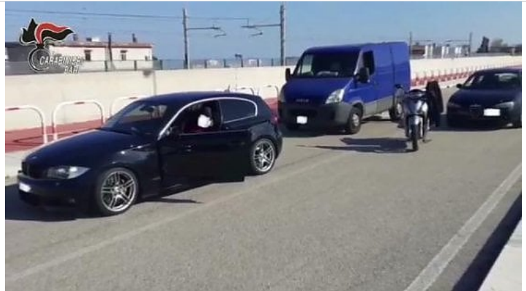
Un'immagine del video con l'assalto al portavalori: la realizzazione è stata bloccata dai carabinieri

L'azione al quartiere Sant'Anna alla periferia del rione Japigia. L'allarme di alcuni cittadini che avevano visto la scena. In un'auto trovate pistole giocattolo prive del tappo rosso di protezione