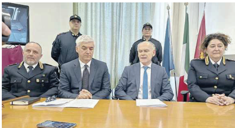
La conferenza stampa che ha illustrato l'operazione che ha portato a due arresti per l'assalto all'Ivri

CONTESTATA DALLA PROCURA DISTRETTUALE L'AGGRAVANTE DEL METODO MAFIOSO