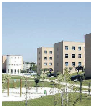
La sede dell'Università