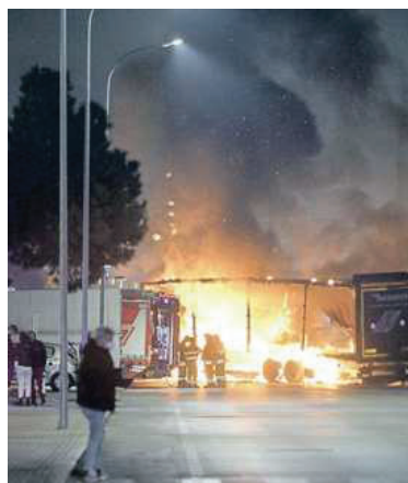
L'assalto alla sede Ivri