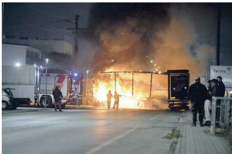
L'assalto alla Ivri di San Giovanni Teatino