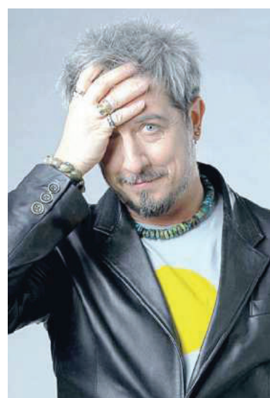
L'attore Paolo Ruffini

LA BIMBA AFFETTA DA ATROFIA MUSCOLARE-SPINALE SIMBOLO DELLA LOTTA CONTRO LE MALATTIE GENETICHE