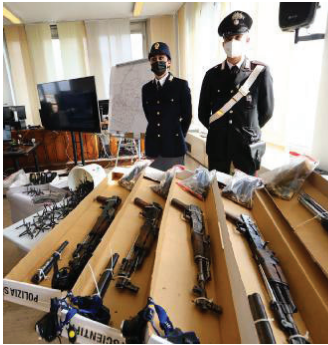
Il blitz. Alcune delle armi sequestrate da polizia e carabinieri

Si è chiuso così il processo in abbreviato a carico delle 33 persone ritenute i responsabili della tentata rapina sventata la sera dell'11 marzo dello scorso anno dall'intervento dei Nocs dei carabinieri