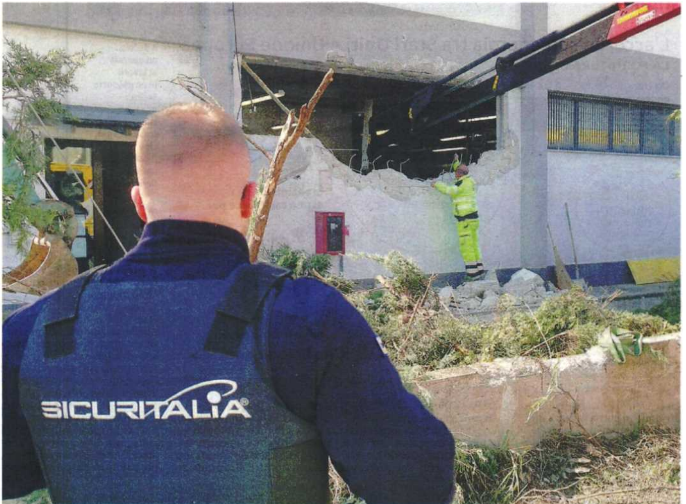
Il muro abbattuto dai rapinatori per assaltare l'istituto di vigilanza Sicuritalia-Ivri di San Giovanni Teatino

San Giovanni Teatino. Nel caveau ce n'erano altri 80, in azione la malavita foggiana