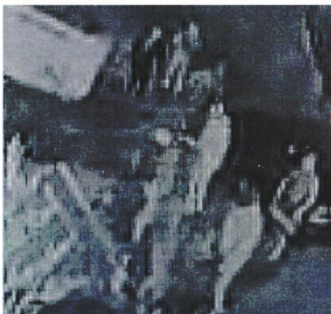
I RAPINATORI ARRIVANO DAVANTI ALL'IVRI