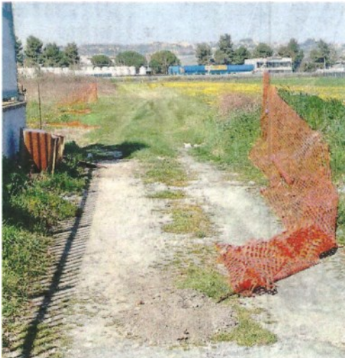
La via di fuga dei banditi, verso l'Asse. Sopra, il muro demolito con la ruspa