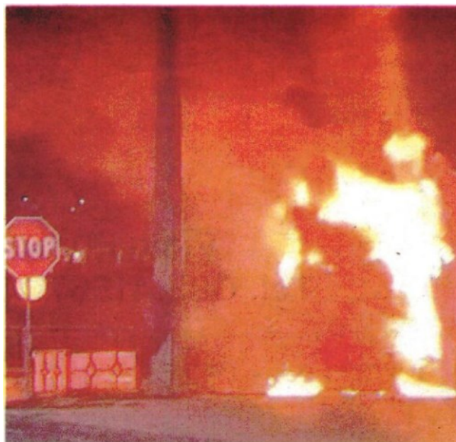
L'inferno di fuoco sulle strade di San Giovanni Teatino durante la rapina