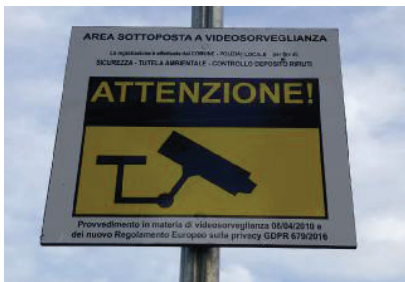
Oltre 400 le multe comminate tramite le fototrappole

Nel 2021 incassati 350 mila euro, recuperati 50 veicoli e 100 bici. Il sindaco rilancia: «L'obiettivo è la totale raccolta a domicilio»