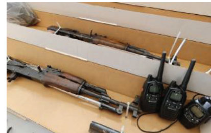
Armi e radio destinate ad essere usate nell'assalto al caveau

Rigettato l'arresto del proprietario del capannone