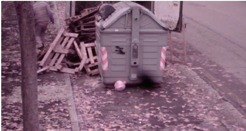
Un uomo, nel frame fornito in occasione della presentazione del bilancio, abbandona i rifiuti vicino ad un cassonetto e poi se ne va

IL BILANCIO Il contrasto alla maleducazione e all'incuria prosegue con Loggia e Aprica