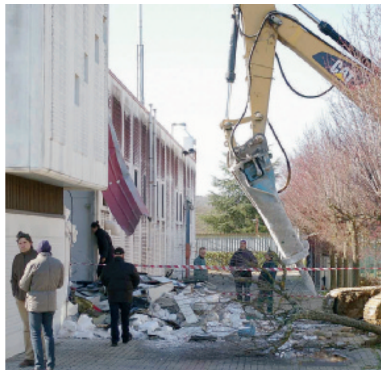
ALLA SALP Il punto dove i ladri sono entrati per fare razzia

ECCOCI alla diagnosi di Confindustria: «Di sicuro — spiega Di Donato — alcune aziende non hanno aggiornato i sistemi di allarme e questo è un nostro grave difetto; poi c'entra di sicuro la vigilanza privata, ad Arezzo non proprio organizzatissima anche se mi risulta che alcuni istituti sti-