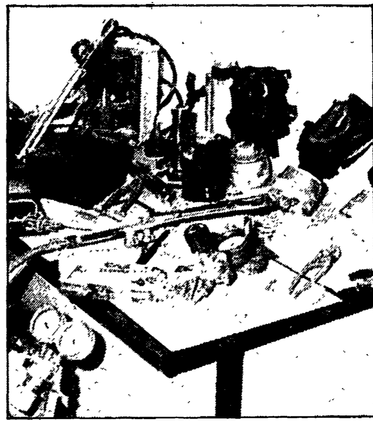
Lancia termica e maschere antigas lasciate dai ladri

Gli specialisti della lancia termica sono tornati all'opera. E stavolta si son fatti beffe della tanto reclamizzata «segreta» di una polizia privata, la «Mondialpol», portandosi via un paio di miliardi: erano gli incassi dei negozianti, consegnati sabato ai «vigilantes». Non è il primo furto nel vecchio edificio di via Alessandria 200. Già nel dicembre scorso sparirono dal caveau oltre tre miliardi. Ma in quel caso i ladri entrarono tranquillamente dalla porta principale, perché gli autori erano le stesse guardie giurate, compreso l'ex direttore della Mondialpol.