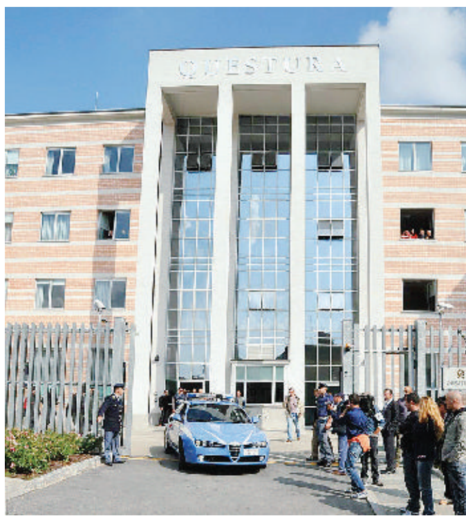
Folla di cronisti e fotografi ieri davanti alla Questura di Biella

A restare in libertà, oltre agli altri quattro componenti del «commando», ci sono anche i probabili mandanti e fian-