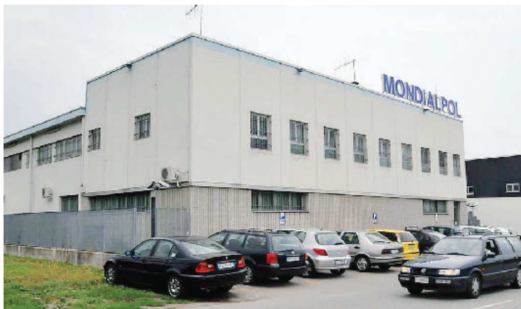
La sede Mondialpol di Vigliano, assaltata domenica 31 agosto da un commando di sei persone

Resta ovviamente aperta l'ipotesi del basista. Non necessariamente un dipendente della Mondialpol: a dare le dritte giuste può anche essere stato qualcuno che ha fat-