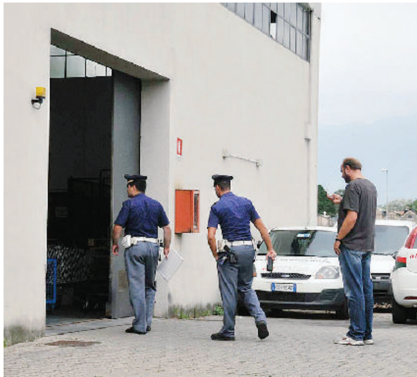
La polizia sul luogo della rapina, la mattina di domenica 31 agosto

A tale proposito, gli inquirenti non hanno molti dubbi sulla maggiore difficoltà a trovare una risposta a quest'ultima domanda rispetto alle altre. L'identificazione della coppia di rapinatori in un tempo relativamente breve dal giorno del colpo, fa presumere che il lavoro degli agenti della Questura abbia condotto ad una pista vincen-