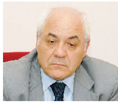
Il procuratore Ugo Adinolfi