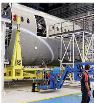
FUSOLIERA L'impianto di Grottaglie

● Il successo a livello mondiale del Boeing 787, con ali e fusoliera in fibra di carbonio, si riverbera in maniera positiva sugli stabilimenti Alenia di Foggia e Grottaglie. Entrambe le aziende hanno visto rinnovati i contratti per produrre le parti in fibra di carbonio per altri 200 aerei. Ricaduta positiva anche sull'aeroporto di Grottaglie dove vengono imbarcati su giganteschi cargo i pezzi da assemblare.