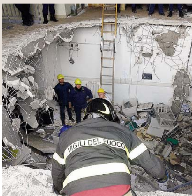
BARI Il pavimento divelto con la ruspa per entrare nel caveau [Luca Turri]