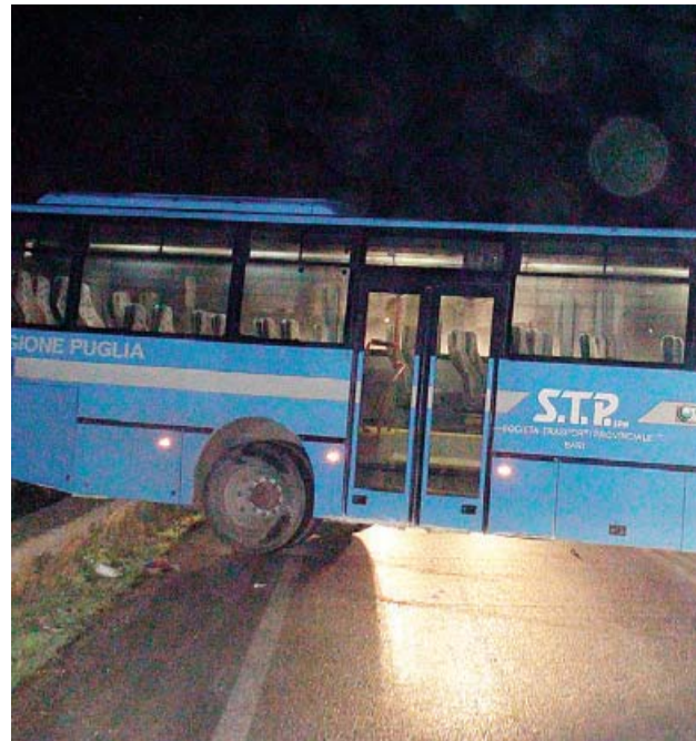
LA SEQUENZA A sinistra alcune immagini della spettacolare rapina consumata ai danni della «Securcenter» tra Bitonto e Santo Spirito. Miracolosamente nonostante i proiettili esplosi nessuno è rimasto ferito

COME IN UN FILM SPARI CONTRO UN VIGILANTE SALVATO DAL GIUBBOTTO ANTIPROIETTILE. INSEGUIMENTI CON POLIZIA E CARABINIERI. E POI UNA ESCAVATRICE, CHIODI PER STRADA E PULLMAN PER BLOCCARE IL TRAFFICO