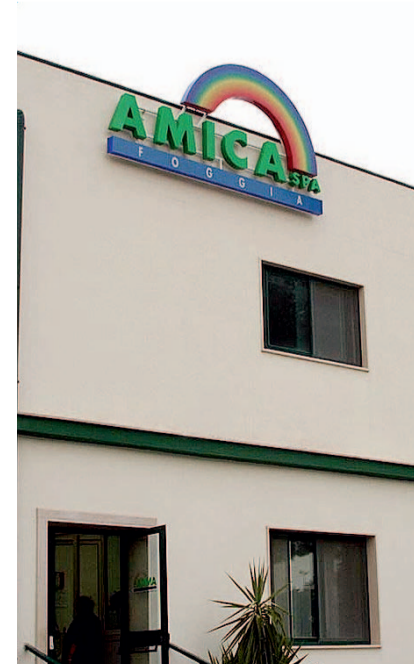
AMICA La sede dell'azienda

Il pm nel chiedere il rinvio a giudizio dei 10 imputati individuò tre parti offese, informandole della possibilità di costituirsi parte civile, il che non è avvenuto ieri: direzione regionale per le entrate per la presunta evasione; la stessa azienda «Amica» attualmente commissariata; il Comune di Foggia, sul presupposto che quale socio unico dell'«Amica» fu tratto in inganno (il reato di false comunicazioni sociali viene contestato a 8 imputati) perché «cda», collegio sindacale e direttore generale avrebbero esposto fatti non veri sulle condizioni economiche dell'azienda per la raccolta dei rifiuti; e l'avrebbero fatto per nascondere al Comune le perdite di esercizio e per mantenere la carica.