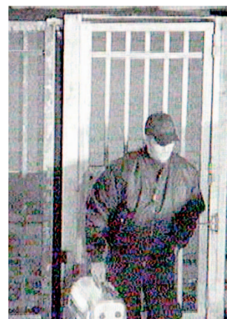
IL FILMATO Le telecamere della «Np service» filmarono il ladro che rimase nella sede dell'istituto scorta valori per due ore la notte del primo maggio del 2009; in basso a sinistra la sede al Villaggio Artigiani