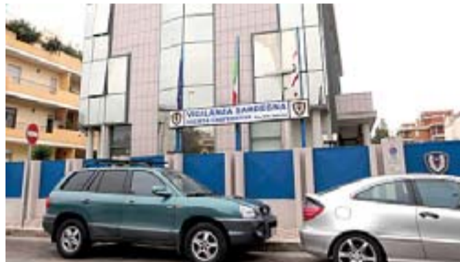
A sinistra, la sede cagliarita della cooperativa Vigilanza Sardegna; sotto, il furgone che ha trasportato il denaro da Cagliari a Nuoro