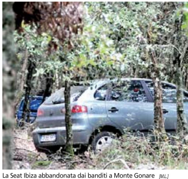
La Seat Ibiza abbandonata dai banditi a Monte Gonare (ML)

Posti di blocco e campagne al setaccio, carabinieri e polizia in azione anche in Ogliastra Trovate a Orani le auto dei banditi