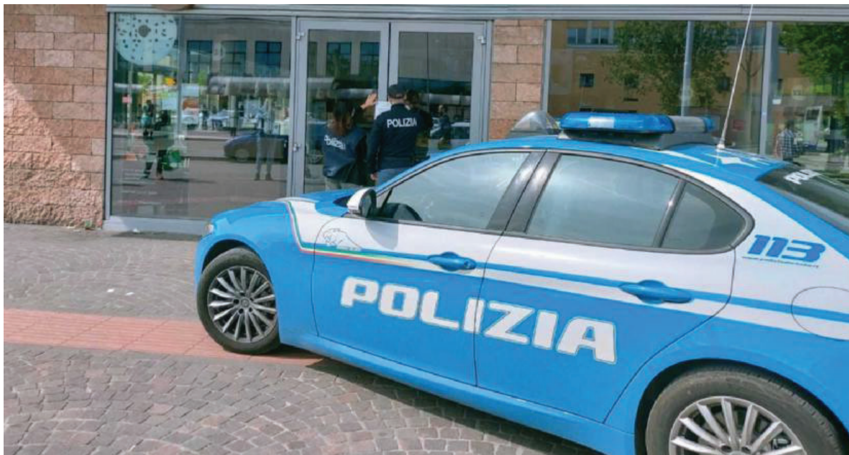
Licenza sospesa Il bar 12 OZ resta chiuso per un paio di settimane dopo i controlli eseguiti dalle Volanti negli ultimi giorni

IN STAZIONE I poliziotti delle Volanti in un giorno hanno trovato all'interno del locale 11 persone con precedenti penali