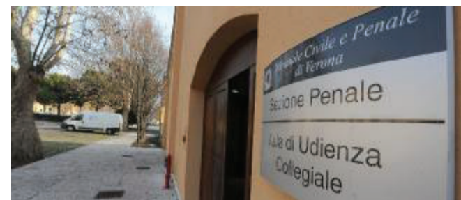
In aula Il processo si è svolto ieri davanti al tribunale collegiale

Una persona è dovuta intervenire per interrompere i presunti abusi