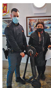
Riconsegna Il monopattino torna alla sua proprietaria

●●● Sono stati gli agenti del commissariato Appio ad arrestare per rapina, violenza e resistenza a Pubblico ufficiale, un romeno che due giorni fa, mentre si trovava nei pressi della fermata metro «Colli Albani», approfittando della distrazione di una donna che sistemava le buste della spesa, uscita dal supermercato, poco prima di salire sul suo monopattino, è salito a bordo del mezzo e si è dato alla fuga. La scena è stata notata dai poliziotti che, anche se a piedi, sono riusciti a raggiungerlo all'incrocio di via Albano dove, dopo aver perso il controllo del monopattino ha continuato, per non essere bloccato, a divincolarsi con spintoni e calci. S.F., senza fissa dimora di 35 anni, è stato arrestato.