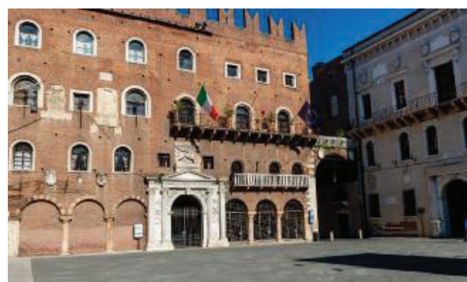
Palazzo di Governo Decisione del prefetto in accordo con il questore

prefetto di Verona per la sensibilità mostrata nei confronti del lavoratore, ingiustamente sospeso senza stipendio, e della sua famiglia. Il prefetto, apprezzati i diritti e le ragioni del collega, ha tolto dalle secche la pratica, iniziata con il sequestro di polizia del 14 aprile 2023, e riconoscendo le ragioni del ricorso, ha fatto restituire l'arma al collega che nel frattempo ha acquistato una nuova cassaforte con tastiera elettronica e quindi di ancor più difficile accesso. Inoltre il ragazzo è stato posto in una comunità, quindi non vive più con la famiglia», ha detto il segretario