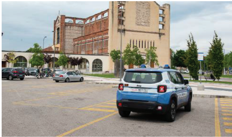
Porta Nuova Un'auto della polizia nella zona dove è avvenuta l'aggressione

«Ho continuato a camminare, rispondendogli di star bene. Successivamente, non contento, mi ha seguito e ha continuato a mettermi le mani addosso cercando di trovare denaro o qualche oggetto prezioso. Mi ha sfilato dalla