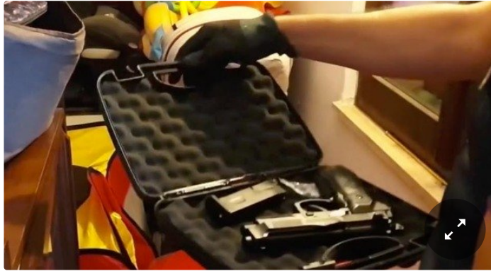
2 Minuti di Lettura

Al padre, dopo i guai giudiziari del figlio, era stata tolta la pistola e licenza di porto d'armi per difesa personale