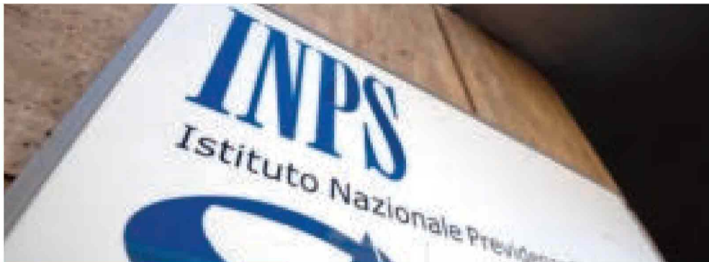
Non è l'unico caso in Italia