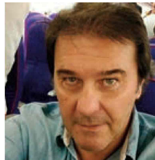
Carabiniere in pensione