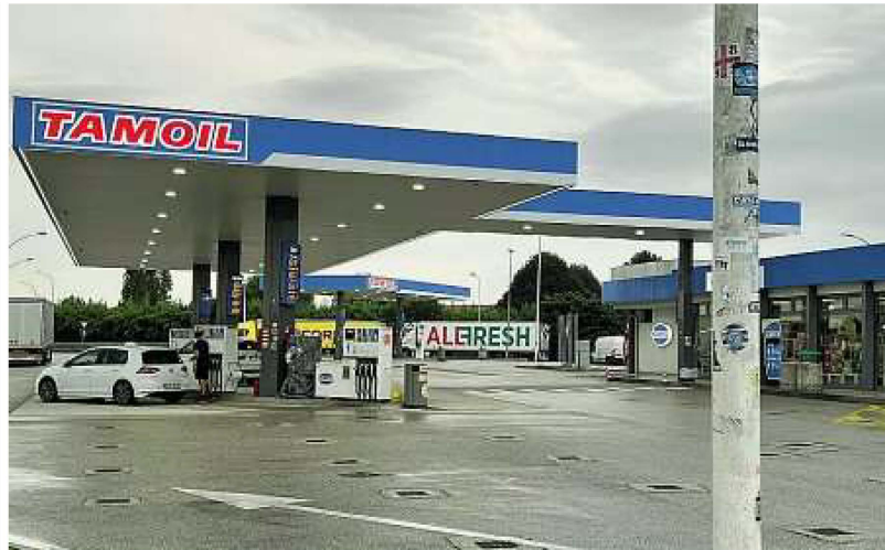
L'area di servizio L'area di servizio Tesina Est, nel territorio comunale di Grisignano di Zocco: qui è avvenuto l'incidente

Tutto è iniziato intorno alle 23.25 di venerdì quando gli agenti della polizia stradale di Padova, in servizio di vigilanza sull'autostrada A4, hanno ricevuto una segnalazione