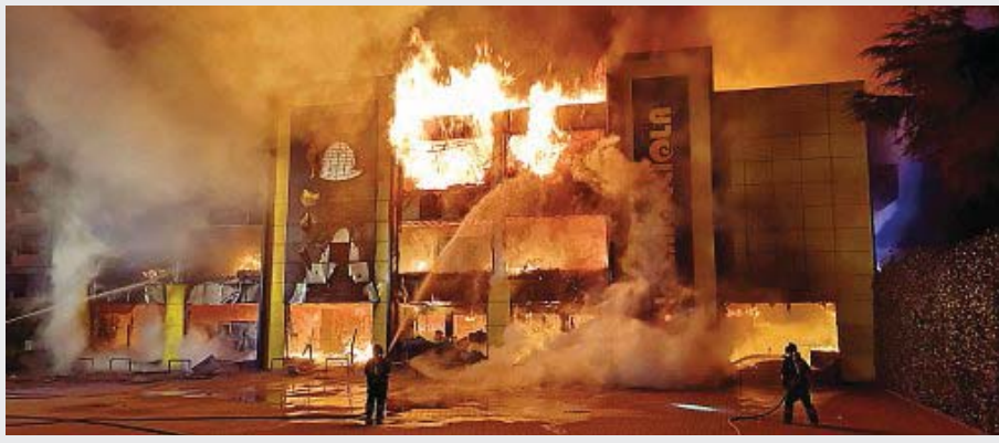
Fiamme Vigili del fuoco al lavoro per spegnere il rogo scoppiato sabato sera a Varedo, al negozio di giocattoli «La Chiocciola»